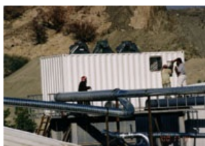
Entstaubungssystem für einen Steinbruch in der Nähe von Mekkah

Im Inneren ist der Containerfilter ein steckerfertiger Großentstauber mit Ventilator, Steuerung, Filterelementen, Jet-Abreinigung und standort-spezifischem Sonderzubehör wie z.B. für Saudi Arabien, ein spezielles Frischluftsystem gegen Aufheizen. Auf der Baustelle wird der Container auf die Unterkonstruktion, die als Zubehör mitgeliefert oder kunden-seitig beigestellt wird, aufgesetzt und mittels der 4 Containerbefestigungen verankert. Nach Anschluss von Rohrleitungen und Elektrik ist der Filter betriebsbereit.